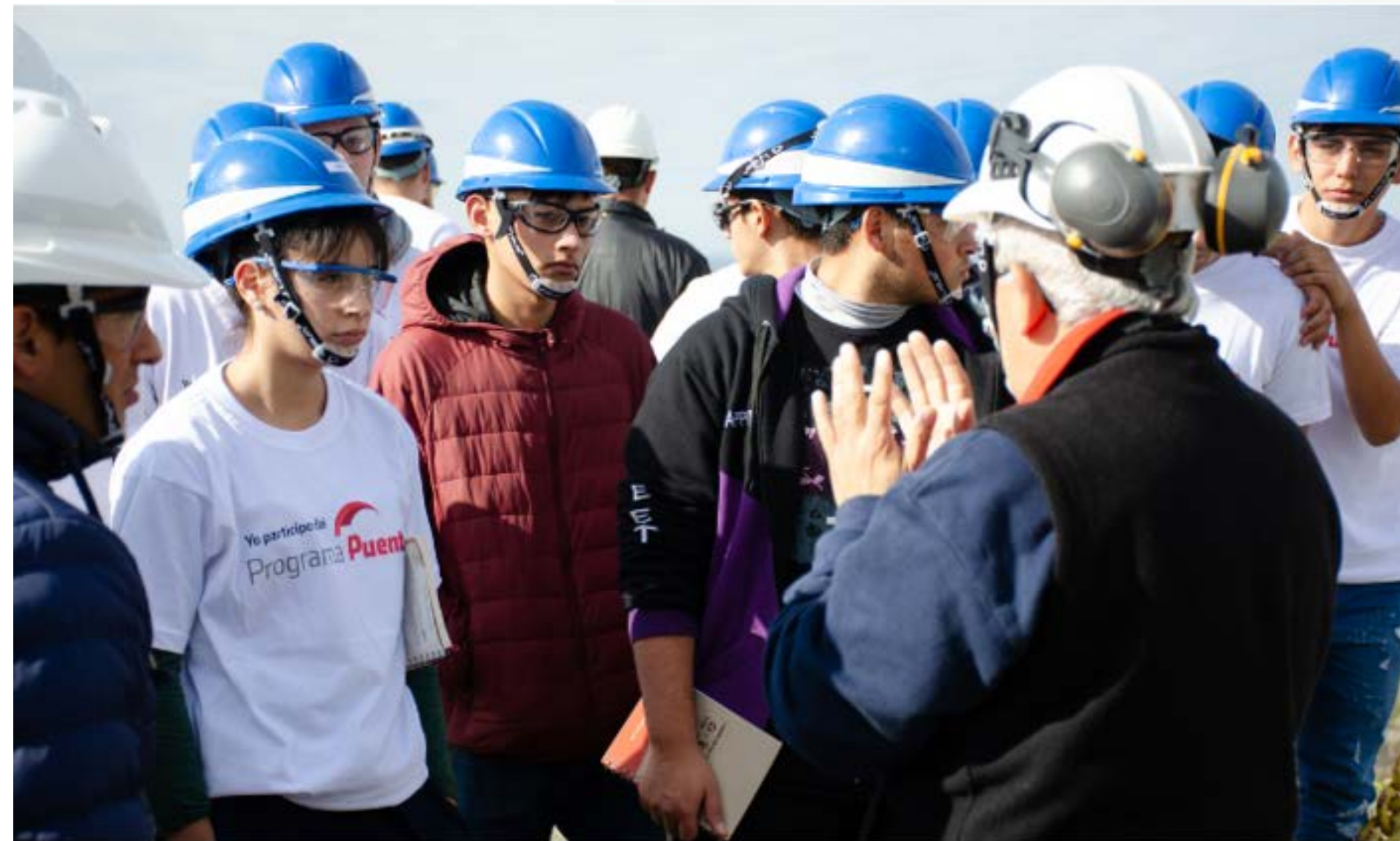
Programa Puente visita a planta Catamarca