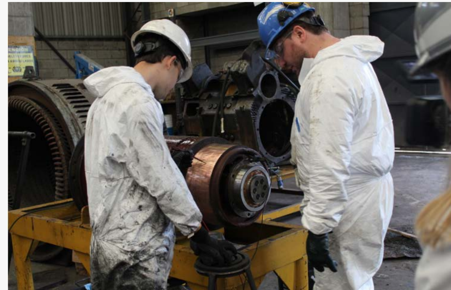
Programa Puente prácticas profesionalizantes Ferrosur Olavarría